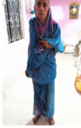
ପାଇଁ ସାଧାରଣରେ ଦାବି ହେଉଛି । ମୁଖ୍ୟମନ୍ତ୍ରୀ କ ନିଜ ଜିଲ୍ଲା ରେ ଅଧ୍ୟାୟ ଅଧିକାରୀଙ୍କ ପାଇଁ ଏହି ଭଳି ଘଟଣା ବେଶ୍ ସାଧାରଣ ନୁହେଁ ।

ଭୟଭୀତ କରାଇ ଦେଇଛନ୍ତି । ଫଳରେ ମହିଳା ଜଣକ ଭୟରେ ଅଧିକ ହୋଇପଡ଼ିଛନ୍ତି । ଏତେ ଲୋକଙ୍କୁ ସାଙ୍ଗରେ ନେଇ ଯୋଗାଣ ଅଧିକାରୀ ତଦନ୍ତ କରିବାକୁ ଯିବା ଯୋଗାଣ ବିଭାଗ ର ସ୍ୱଚ୍ଛତା ଉପରେ ବଡ଼ ପ୍ରଶ୍ନବାଦୀ ସୃଷ୍ଟି କରିଛି । କେନ୍ଦ୍ରରେ ଜିଲ୍ଲା ହାଟଡିହି ବ୍ଲକର ଶାଳନିଆଁ ପଞ୍ଚାୟତ ରାଧାକାଣ୍ଡା ରାଉଳ ବଞ୍ଚିଥିବା ବେଳେ ତାଙ୍କୁ କାଗଜ କଳମ ରେ କିଏ ମାରିଦେଲେ କିଏ ଏହି ମୃତ ରିପୋର୍ଟ ଦେଇ ତାଙ୍କର ଅତ୍ୟାଧିକ ଅନୁ ଯୋଜନାରେ କାର୍ଡ କୁ କାଟି ଦେଇଛନ୍ତି । ତାହାର ତଦନ୍ତ ଏବେ ରହସ୍ୟ ଘେରାଉ ଥିବା ବେଳେ ଯୋଗାଣ ଅଧିକାରୀଙ୍କ ଧନକ ଘଟଣାକୁ ଏକ ଭିନ୍ନ ମୋଡ଼ ନେଉଛି । ହାଟଡିହି ବ୍ଲକ ରେ ଅଧ୍ୟାୟ ଓ ପୁନଃସଂଗଠନ ଯୋଗାଣ ଅଧିକାରୀଙ୍କ ଉପରେ ଏହି ଘଟଣାର ତଦନ୍ତ କରି ଦୂର କାର୍ଯ୍ୟାନୁଷ୍ଠାନ ଗ୍ରହଣ କରାଯିବ ସହ ବୃଦ୍ଧାଙ୍କୁ ତୁରନ୍ତ ରାସନ କାର୍ଡ ଯୋଗାଇ ଦେବା