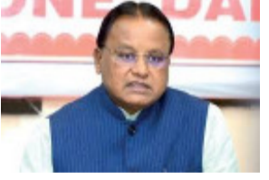
ସହାୟକ, ମାଧ୍ୟମିକ ଶିକ୍ଷା ପରିଷଦର ୧୮ ଜଣ କନିଷ୍ଠ ସହାୟକ ଓ ଉଚ୍ଚ ମାଧ୍ୟମିକ ଶିକ୍ଷା ନିର୍ଦ୍ଦେଶାଳୟରେ ଅଧିକରେ ୨ ଜଣ ସମାପକଙ୍କୁ ଏହି ଅବସରରେ ନିଯୁକ୍ତିପତ୍ର ପ୍ରଦାନ କରିବେ । ଭୁବନେଶ୍ୱର ଯୁନିଟ୍-୩ରୁ

ନିଯୁକ୍ତିପତ୍ର ପ୍ରଦାନ କରିବାକୁ ବିଦ୍ୟାଳୟ ଓ ଗଣଶିକ୍ଷା ବିଭାଗର ଓଡ଼ିଶା ଆଦର୍ଶ ବିଦ୍ୟାଳୟ ଓ ଓଡ଼ିଶା ମାଜିନି ଆଦର୍ଶ ବିଦ୍ୟାଳୟ ନିମନ୍ତେ ୮୯୪ ଜଣ ଅଧ୍ୟାପକ ଏବଂ ଶିକ୍ଷକ-ଶିକ୍ଷୟିତ୍ରୀଙ୍କୁ ନିଯୁକ୍ତିପତ୍ର ପ୍ରଦାନ କରାଯିବାରୁ ଥିବା ବେଳେ ପୂର୍ଣ୍ଣ ଅନୁଦାନପ୍ରାପ୍ତ ବେସରକାରୀ ଉଚ୍ଚ ବିଦ୍ୟାଳୟରେ ୧୭୯୮ ଜଣ ଶିକ୍ଷକ-ଶିକ୍ଷୟିତ୍ରୀ, ଉଚ୍ଚ ମାଧ୍ୟମିକ ଶିକ୍ଷା ପରିଷଦରେ ୨୮ ଜଣ କନିଷ୍ଠ ସହାୟକ, ଉଚ୍ଚ ମାଧ୍ୟମିକ ଶିକ୍ଷା ନିର୍ଦ୍ଦେଶାଳୟରେ ୨୭ ଜଣ କନିଷ୍ଠ