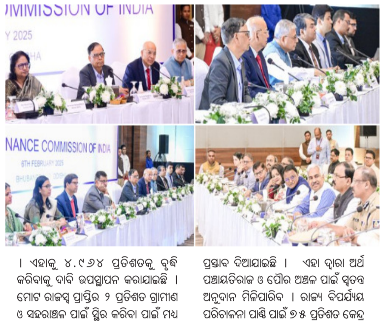
Y 2025 INANCE COMMISSION OF INDIA

ଅଧିକ ଅର୍ଥକ ସହାୟତା ଆସିବ ବୋଲି ଆଶା ଅଛି ବୋଲି ମୁଖ୍ୟମନ୍ତ୍ରୀ କହିଛନ୍ତି । ଭାରତର ଶ୍ରେଷ୍ଠ ୫ଟି ରାଜ୍ୟ ଭିତରେ ରହିବା ପାଇଁ ଓଡ଼ିଶାର ଲକ୍ଷ୍ୟ ରହିଛି ବୋଲି ମୁଖ୍ୟମନ୍ତ୍ରୀ କହିଛନ୍ତି । ଦାବିରେ ସହଯୋଗ, କୃଷି ଓ ଗ୍ରାମ୍ୟ ଉନ୍ନୟନ, ଏମିସିଏଏମ, ବନ୍ଦର ଆଧୁନିକ ଅର୍ଥନୀତି, ଦକ୍ଷତା ବିକାଶ ଉପରେ ଅର୍ଥକ ଦିନ ଉପରେ ବିଶ୍ୱତ ଆଲୋଚନା ହୋଇଛି । କମିସନ ନିକଟରେ ବିକଶିତ ଓଡ଼ିଶା ପାଇଁ ରାଜ୍ୟ ସରକାର ପ୍ରସ୍ତାବ ଦେଇଛନ୍ତି । ଅର୍ଥ କମିସନ ନିକଟରେ ହୋଇଥିବା ଦାବି ରାଜ୍ୟ ସରକାରଙ୍କ ୨୦୨୬-୨୦୩୧ ପଞ୍ଚବାର୍ଷିକ ଯୋଜନା ମାଧ୍ୟମରେ ଏହା ପ୍ରତିଫଳିତ ହେବାର ଆଶା ରହିଛି ବୋଲି ଅର୍ଥ ବିଶେଷଜ୍ଞ ମତପୋଷଣ କରିଛନ୍ତି । ଏହାକୁ ଦୃଷ୍ଟିରେ ରଖି ଅର୍ଥ କମିସନ ନିକଟରେ ମୋଟ ୧୨ ଲକ୍ଷ ୫୯ ହଜାର ୧୪୮ କୋଟି ଟଙ୍କାର ଦାବି ଉପସ୍ଥାପନ କରାଯାଇଛି । ପୂର୍ବ ଅପେକ୍ଷା