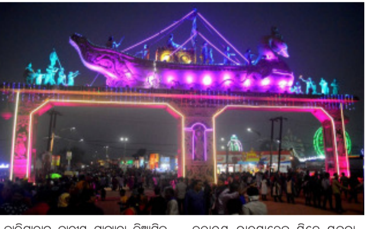
ବାଲିଯାତ୍ରାକୁ ଜାତୀୟ ମାନ୍ୟତା ଦିଆଯିବ ବୋଲି ପ୍ରତିଶ୍ରୁତି ଦେଇଥିଲେ । କଟକ ବାଲିଯାତ୍ରାକୁ ଯୁବଦେବ୍ୟ ମାନ୍ୟତା ଦିଆଯିବାରୁ ପ୍ରଦେଶ ଆରମ୍ଭ ହୋଇଛି । ସେଥିପାଇଁ ବିଭିନ୍ନ ଜାତୀୟ ସ୍ତର କାର୍ଯ୍ୟକ୍ରମରେ ଏ ନେଇ ପ୍ରଚାର ପ୍ରସାର ପାଇଁ ପଦକ୍ଷେପ ନିଆଯିବ ବୋଲି କିଲ୍ଲୁପାଳ

ଭୁବନେଶ୍ୱର, ୭/୨: ପ୍ରଧାନମନ୍ତ୍ରୀ ନରେନ୍ଦ୍ର ମୋଦୀ ତାଙ୍କର ପ୍ରତିଶ୍ରୁତି ରଖିଛନ୍ତି । ତାଙ୍କର ପ୍ରତିଶ୍ରୁତି ଅନୁସାରେ କଟକ ବାଲିଯାତ୍ରାକୁ 'ଜାତୀୟ ମାନ୍ୟତା' ମିଳିଛି । ସଂସ୍କୃତି ମନ୍ତ୍ରାଳୟ ପକ୍ଷରୁ 'ଜାତୀୟ ମାନ୍ୟତା' ନେଇ ସୂଚନା ଜାରି ହୋଇଛି । ଆଜି ରାଜ୍ୟସଭାରେ ସଂସ୍କୃତି ମନ୍ତ୍ରୀ ଜଗନ୍ନାଥ ସିଂ ଶେଖାପୁଟ ଏହି ସୂଚନା ଦେଇଛନ୍ତି । ଓଡ଼ିଶାର ପ୍ରମୁଖ ଯାତ୍ରାଯାତ୍ରାକୁ ଅଧିକ ଲୋକପ୍ରିୟ କରିବା ପାଇଁ ପଦକ୍ଷେପ ନିଆଯାଇଛି । ରାଜ୍ୟରେ ତଦକ୍ଷ୍ମ ଲଞ୍ଜିନ ସରକାର ଚାଲିବା ପରେ କେନ୍ଦ୍ର ସରକାର ଓଡ଼ିଶା ସଂସ୍କୃତିକୁ ସୁଦୃଢ଼ ଗୁରୁତ୍ୱ ଦେଇଛନ୍ତି । ଏହି କ୍ରମରେ କଟକର ଐତିହାସିକ ବାଲିଯାତ୍ରା ମଧ୍ୟ ବାବ୍ଦ ପଡ଼ିନାହିଁ । ପ୍ରଧାନମନ୍ତ୍ରୀ ନରେନ୍ଦ୍ର ମୋଦୀ ବିଭିନ୍ନ କାର୍ଯ୍ୟକ୍ରମରେ ଦେଖାଦେଖି ଉଦ୍ଦେଶ୍ୟରେ ଦେବା ସମୟରେ ଏକାଧିକ ଥର 'କଟକ ବାଲିଯାତ୍ରା'ର ନାମ ନେଇଛନ୍ତି । ଜାତୀୟ ବାଣିଜ୍ୟିକ ମେଳାରେ ସେ ବାଲିଯାତ୍ରାକୁ ପ୍ରଶଂସା ମଧ୍ୟ କରିଛନ୍ତି । ପୂର୍ବରୁ ସେ