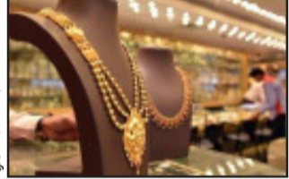
ଭୁବନେଶ୍ୱର, ୨୪/୧: ଭୁବନେଶ୍ୱର ଉପକଣ୍ଠ ଅଞ୍ଚଳରେ ସୁନା ଦର ବୃଦ୍ଧି ସାଧାରଣ ଲୋକଙ୍କ ଚିନ୍ତାର ବିଷୟ ହୋଇପଡ଼ିଛି । ଭୁବନେଶ୍ୱରରେ ୨୪ କ୍ୟାରେଟର ସୁନା ଦାମ ୮୨ ହଜାର ଟପିଥିବା ବେଳେ ୨୨ କ୍ୟାରେଟର ସୁନା ଦାମ ୧୦ ଗ୍ରାମ ପଛା ଦର ୭୫ ହଜାର ଟପିଛି ।

ଭୁବନେଶ୍ୱର, ୨୪/୧: ସୁନା ଦରରେ ଲାଗିଛି ନିଆଁ । ବିବାହ ଋତୁରେ ଅହେତୁକ ଭାବେ ସୁନା ଦର ବୃଦ୍ଧି ସାଧାରଣ ଲୋକଙ୍କ ଚିନ୍ତାର ବିଷୟ ହୋଇପଡ଼ିଛି । ଭୁବନେଶ୍ୱରରେ ୨୪ କ୍ୟାରେଟର ସୁନା ଦାମ ୮୨ ହଜାର ଟପିଥିବା ବେଳେ ୨୨ କ୍ୟାରେଟର ସୁନା ଦାମ ୧୦ ଗ୍ରାମ ପଛା ଦର ୭୫ ହଜାର ଟପିଛି । ଆନ୍ତର୍ଜାତୀୟ ସ୍ତରରେ ମଧ୍ୟ ସୁନା ଦରରେ ବୃଦ୍ଧି ଦେଖିବାକୁ ମିଳିଛି । ତେଣୁ ଲୋକମାନଙ୍କୁ ଟ୍ରମ୍ପ ଆମେରିକା ରାଷ୍ଟ୍ରପତି ଭାବେ ଶପଥ ନେବା ପରେ ସୁନା ଦରରେ ନିବେଶ ପାଇଁ ଲୋକେ ଆଗ୍ରହ ପ୍ରକାଶ କରିଛନ୍ତି । ଟ୍ରମ୍ପଙ୍କ ବିଜୟ ନିଶ୍ଚିତ ଅର୍ଥନୀତିରେ ଅସ୍ଥିରତା ସୃଷ୍ଟି କରିବା ଆଶଙ୍କା କରି ଅଧିକାରୀ ଲୋକ ଏବେ ସୁନାରେ ନିବେଶ କରୁଛନ୍ତି । ଅର୍ଥନୀତିରେ ଅସ୍ଥିରତା ବେଳେ ସୁନାରେ ନିବେଶ ବେଶ ପ୍ରାଣକ୍ଷିପ୍ତ । ସେହିଭଳି ତଳାର ଦୁର୍ବଳ ହେବା ମଧ୍ୟ ସୁନା ଦର ବୃଦ୍ଧି ପଛର ଅନ୍ୟ ଏକ କାରଣ । ବିବାହ ଋତୁରେ ସୁନା ଦର ବୃଦ୍ଧି ଏବେ ସାଧାରଣ ଲୋକଙ୍କ ନିଦ ଉଡ଼ାଇଛି ।