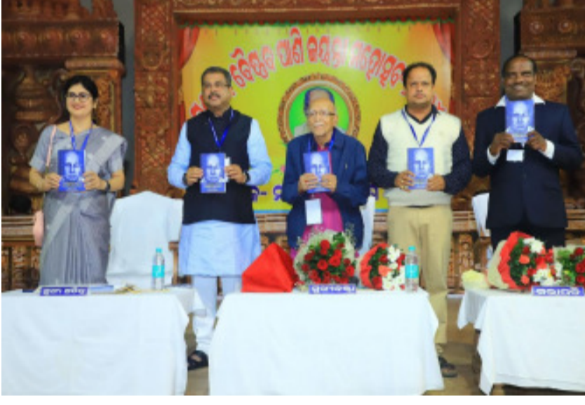
କାବ୍ୟର କଥା କହିଛନ୍ତି । ଜାତି-ଅଜାତିର କଥା ସହ ଧର୍ମ ଓ ଅଧର୍ମ, ସମାଜ ସଂସ୍କାର କଥା କହିଛନ୍ତି । ହଜାର ହଜାର ବର୍ଷର ସାହିତ୍ୟକୁ କଣ୍ଠସ୍ତ କରି

ଭୁବନେଶ୍ୱର, ୦୧/୧୨ (ନି.ପ୍ର): ୨୦୩୬ ପୃଷ୍ଠା ଓଡ଼ିଶାକୁ ପୁସ୍ତକର ଅଗ୍ରଣୀ ଅଞ୍ଚଳ କରିବା ପାଇଁ ପ୍ରଧାନମନ୍ତ୍ରୀ ନରେନ୍ଦ୍ର ମୋଦି ଆହ୍ୱାନ କରିଛନ୍ତି । ତାଙ୍କ ଆହ୍ୱାନ କ୍ରମେ ଆମେ ସମସ୍ତେ ନିର୍ଦ୍ଧାରିତ ସମୟ ସୁଦ୍ଧା ଗଣକବି ବୈଷ୍ଣବ ପାଣି ଏବଂ ଓଡ଼ିଶାର ମହାପୁରୁଷଙ୍କ ବିଚାର ଆଧାରରେ ଓଡ଼ିଆ, ଭାଷା, ସଂସ୍କୃତି ତଥା ଓଡ଼ିଆ ଜାତିର ପୁନଃପରିଚୟ ତିଆରି କରିବା ପାଇଁ ଏକାଠି ହେବା । ଭାଷା ଭିତ୍ତିରେ ଓଡ଼ିଶା ସ୍ୱତନ୍ତ୍ର ରାଜ୍ୟ ଭାବେ ଗଠନ କରିବାକୁ ଚାହୁଁଥିବା ବେଳେ କିପରି ଆମ ରାଜ୍ୟ ବିଶ୍ୱ ମାନଚିତ୍ରରେ ପ୍ରତିଷ୍ଠିତ ହେବ ସେଥିପାଇଁ ସାମୁହିକ ଉଦ୍ୟମ କରିବାକୁ ଆହ୍ୱାନ କରିଛନ୍ତି କେନ୍ଦ୍ର ଶିକ୍ଷା ମନ୍ତ୍ରୀ ଧର୍ମେନ୍ଦ୍ର ପ୍ରଧାନ । ସେହିପରି ବିଶ୍ୱ ସମସ୍ୟାର ସମାଧାନର ପ୍ରୟୋଗଶାଳା ଓଡ଼ିଆ ଭାଷା ସାହିତ୍ୟରେ ଅଛି ବୋଲି ସେ କହିଛନ୍ତି । ଶନିବାର ଭୁବନେଶ୍ୱର ଠାରେ ମାହାଙ୍ଗା ବିକାଶ ପରିଷଦ ଆନୁକୁଲ୍ୟରେ ଗଣକବି ବୈଷ୍ଣବ ପାଣିଙ୍କ ୧୪୨ତମ ଏତିହାସିକ ଜୟନ୍ତୀ ମହୋତ୍ସବର ଉଦ୍‌ଘାଟନ ସମାରୋହରେ ଯୋଗଦେଇ ଶ୍ରୀ ପ୍ରଧାନ କହିଛନ୍ତି ଯେ ଆଉ ପ୍ରାୟ