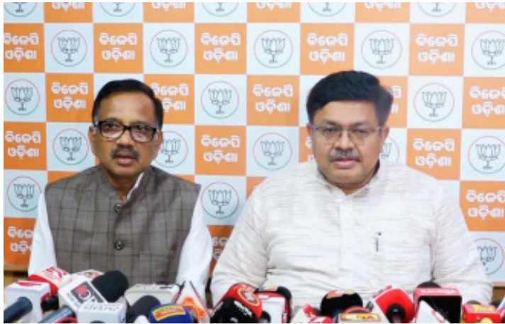
ଚାହୁଁଛନ୍ତି ସେଥିପ୍ରତି କଂଗ୍ରେସ ଦଳର ନଜର ନାହିଁ । ପ୍ରଧାନମନ୍ତ୍ରୀ ମୋଦିଙ୍କୁ ଆମ ରାଜ୍ୟରେ ୩ ଦିନ ପାଇଁ ରହିବା ଏହା ସମସ୍ତଙ୍କ ପାଇଁ ଗୌରବର ବିଷୟ । ଆଗାମୀ ଦିନରେ ଓଡ଼ିଶାର ବିକାଶରେ ଏହା

ଜିନିଷ ଖରାପ ଗୁଣବତ୍ତା ପଶିବା ଆରମ୍ଭ କରିଛି । କଣେ କୋଳର ଚରିତ୍ର ପରବର୍ତ୍ତନ ହେଲେ ଯେପରି ବିଲକ୍ଷଣ ଦେଖିବାକୁ ମିଳେ, ଠିକ୍ ସେଭଳି ପରିବର୍ତ୍ତନ ଏବେ କଂଗ୍ରେସରେ ଦେଖିବାକୁ ମିଳୁଛି । କଂଗ୍ରେସ ଏବେ ସମ୍ପୂର୍ଣ୍ଣ ଦେଶ ବିରୋଧୀ ତତ୍ତ୍ୱ ହେବାକୁ ଆରମ୍ଭ କରିଛି । ବିଦେଶରେ ଯଦି କେହି ଦେଶ ବିରୋଧୀ କଥା କହିଲେ, ଦେଶର ପ୍ରଧାନମନ୍ତ୍ରୀଙ୍କୁ ସମାଲୋଚନା କଲେ ଓ ଦେଶର ବିକାଶ ବିରୋଧରେ କହିଲେ ତାହା କଂଗ୍ରେସକୁ ସୁହାଉଛି । ଏଭଳି ଚିନ୍ତଣକୁ ନେଇ କଂଗ୍ରେସ ଦେଶରେ ଅଧିକାଂଶ କର୍ମୀ ଜନସାଧାରଣଙ୍କୁ ଛୁଆଁ ଦୁଲାଇବାକୁ ଉଦ୍ୟମ କରୁଛି । ଦେଶର କୌଣସି ବିକାଶକର କଥା ଉଠିଲେ ଏହାର ପ୍ରତିଟି ପର୍ଯ୍ୟାୟକୁ ବିରୋଧ କରୁଛି । ବିକାଶ ବିରୋଧରେ ଅନବରତ ୩୬୫ ଦିନ କହିବାରେ ଲାଗିଛି । କଂଗ୍ରେସ ଦଳ ଏବେ କୋଳ ବିରୋଧୀ ହୋଇଯାଇଛି । ଦେଶ ଏବଂ ଓଡ଼ିଶାର ଲୋକେ କଂଗ୍ରେସ