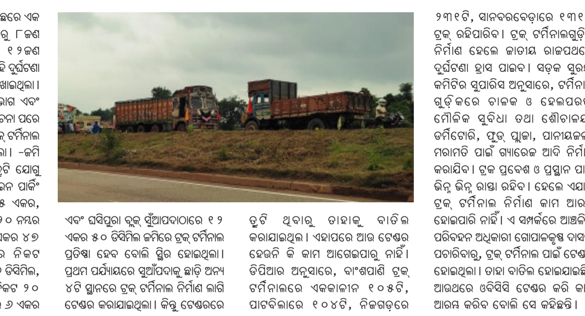
ଏବଂ ଘସିପୁରା ବ୍ଲକ୍ ସୁଆପଦଠାରେ ୧୨ ଏକର ୫୦ ଟି ସିମିଲ କମିଟି ଟ୍ରକ ଚର୍ଚ୍ଚନାଲ ପ୍ରତିଷ୍ଠା ହେବ ବୋଲି ସ୍ଥିର ହୋଇଥିଲା । ନିକଟତରରେ ୧୫ ଏକର ୧୬ ଟି ସିମିଲ, ଘଟଣା ଥାନା ସାନ୍ତାଳବେଡ଼ା ନିକଟ ୨୦ ନୟର ଜାତୀୟ ରାଜପଥ କଡ଼ରେ ୬ ଏକର

ପାଟଣା ୧୮/୧୨ (ନି.ପ୍ର): କେନ୍ଦୁଝର ଜିଲ୍ଲା ଘଟଣା ବ୍ଲକ୍ ବାଲିଯୋଡ଼ି ନିକଟରେ ମର୍ମହୀନ ସଡ଼କ ଦୁର୍ଘଟଣାରେ ୧୨ ଜଣ ଟ୍ରକ ଡ୍ରାଇଭରଙ୍କ ମୃତ୍ୟୁ ଘଟିଥିଲା । ଏହି ଦୁର୍ଘଟଣା ପରେ ପ୍ରଶାସନ ତରଫରୁ ଦେଖାଯାଇଥିଲା । ଜିଲ୍ଲା ପ୍ରଶାସନ, ପରିବହନ ବିଭାଗ ଏବଂ ଏନଏଚଏଆଇର ମିଳିତ ଆଲୋଚନା ପରେ ଡିଏମଏଚ ଅନୁଦାନରେ ୫ଟି ଟ୍ରକ ଚର୍ଚ୍ଚନାଲ ନିର୍ମାଣ ପାଇଁ ନିଷ୍ପତ୍ତି ହୋଇଥିଲା । -କମିଟି ଦ୍ୱାରା ପରେ ଅନୁମତି କାମ ତୁଟି ଯୋଗୁ ଟେଣ୍ଡର ବାତିଲ ବହୁଛି ବୋଲି କମିଟି - ଏଥିପାଇଁ ବାଂଶପାଣିଠାରେ ୫ ଏକର, ଝୁମୁରା ଥାନା ପାଟବିଳା ନିକଟ ୨୦ ନୟର ଜାତୀୟ ରାଜପଥ କଡ଼ରେ ୫ ଏକର ୪୬ ଟି ସିମିଲ, କେନ୍ଦୁଝର ସହର ନିକଟ ପ୍ରତିପା ପର୍ଯ୍ୟାୟରେ ସୁଆପଦକୁ ଛାଡ଼ି ଅନ୍ୟ ଘଟଣା ଥାନା ସାନ୍ତାଳବେଡ଼ା ନିକଟ ୨୦ ନୟର ଜାତୀୟ ରାଜପଥ କଡ଼ରେ ୬ ଏକର