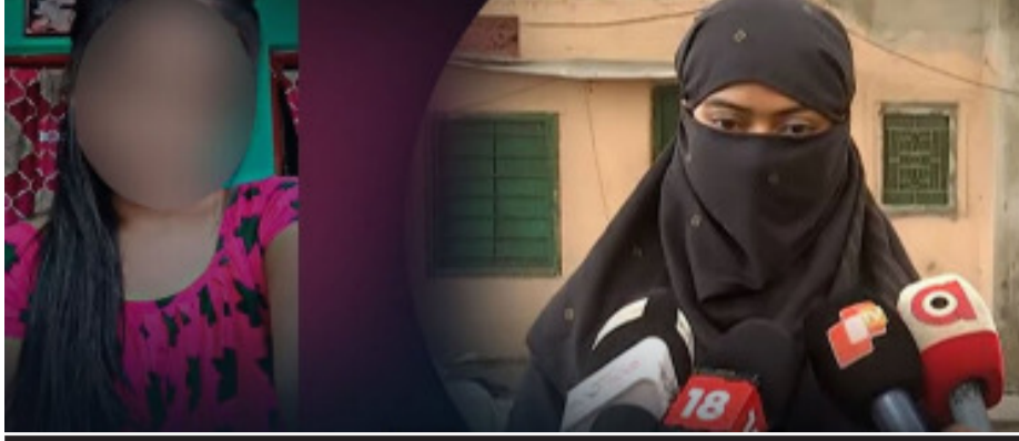
ବାହା ହେବ କହି ସଂପର୍କ ରଖିଲା; ଏବେ ଭିଡିଓ ଭାଇରାଲ୍

ହୋଇଥିବାରୁ ଅମାୟଙ୍କ ପ୍ରସାଦଙ୍କୁ ଅସ୍ୱୀକାର କରିଥିଲେ ଲିମ୍ବା। ହେଲେ ଅମାୟ ଭାରି ଚତୁର ଥିଲେ। ମିଠାମିଠା କଥା କହି ଲିମ୍ବା ମନ ଜିଣିଥିଲେ। ପ୍ରେମରେ ଜାତିପ୍ରଥା ପ୍ରତିବନ୍ଧକ ସାଜିବ ନାହିଁ ବୋଲି କଥା ବେଲଥିଲେ। ପରବର୍ତ୍ତୀ ସମୟରେ ଉଭୟ ପରସ୍ପରକୁ ଭଲ ପାଇଥିଲେ। ବିବାହ କରିବା ପାଇଁ ପରସ୍ପରକୁ କଥା ବେଲଥିଲେ। ଯେଉଁଥିପାଇଁ ଅମାୟଙ୍କ ପାଦ ତଳେ ନିଜକୁ ସମର୍ପି ଦେଇଥିଲେ ଲିମ୍ବା। ଉଭୟ ମିଳାମିଶା ହେଉଥିଲେ। ଏହାର ସୁଯୋଗ ନେଇ ଅମାୟ ଥରେ ଲିମ୍ବାଙ୍କୁ ଏକ ହୋଟେଲ୍ ଡାକି ନେଇଯାଇଥିଲେ। ଲିମ୍ବାଙ୍କ ସହିତ ଶାରୀରିକ ସମ୍ପର୍କ ରଖିବାକୁ ଚାହିଁଥିଲେ। ହେଲେ ଲିମ୍ବା ପ୍ରଥମେ ରାଜି ହୋଇନଥିଲେ। ପରେ ବିବାହର ପ୍ରତିଶ୍ରୁତି ଦେଇ ଅମାୟ ଡାକ୍ ସହିତ ଶାରୀରିକ ସମ୍ପର୍କ ରଖିଥିବା ଅଭିଯୋଗ ହୋଇଛି।