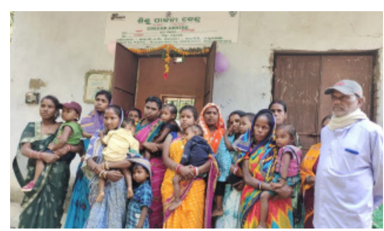
ସେବକ ଓ ନିରାପଦ ପରିବେଶରେ ରହିବାର ବ୍ୟବସ୍ଥା ହୋଇଛି । ଯୋଜନା ଅନୁଯାୟୀ କ୍ଳେଟ କେନ୍ଦ୍ର ନିକଟସ୍ଥ ସ୍ୱାସ୍ଥ୍ୟ କେନ୍ଦ୍ରରୁ ଚିକିତ୍ସା ଓ ଆବଶ୍ୟକ ପ୍ରତିଷେଧକ ଟୀକା ଆଦି ପାଇବେ । ଶିଶୁଟି ବୃଦ୍ଧି ରେକର୍ଡର ସମସ୍ତ ବିବରଣୀ କ୍ଳେଟ କେନ୍ଦ୍ରରେ ଉପଲବ୍ଧ ହେବା ସହିତ ଓୟାଡିସି କ୍ଳେଟ କେନ୍ଦ୍ର ଗ୍ରାମର ସମ୍ବୁଦାୟ

କ୍ଳେଟ କର୍ମୀ ନିଯୁକ୍ତି ପାଇଥିବା ସ୍ତରେ ଗ୍ରାମର ଅଜନଶ୍ରୁତି କର୍ମୀ, ଆଶା କର୍ମୀ ଓ ଗ୍ରାମର ମହିଳା ସ୍ୱୟଂ ସହାୟିକା ନେତ୍ରୀ ଓ ଗ୍ରାମ ଖୁର୍ତ୍ତମେୟର କ୍ଳେଟ କେନ୍ଦ୍ରର ପରିଚାଳନା ଓ କାର୍ଯ୍ୟକ୍ରମର ତଦାରଖ କରିବାରେ ପ୍ରମୁଖ ଭୂମିକା ଗ୍ରହଣ କରିବେ । ଓୟାଡିସି କ୍ଳେଟ କେନ୍ଦ୍ର ମାନଙ୍କର ଦୈନିଦିନ ଖାଦ୍ୟ ସାରଣୀ ଅନୁଯାୟୀ ଶିଶୁଙ୍କ ପାଇଁ ଖାଦ୍ୟ ପରସା ଯିବ । କେନ୍ଦ୍ର ଗୁଡ଼ିକ ସେବାଳ ଙ୍ଗରୁ ଅପରାହ୍ନ ୪ ଘଟିକା ପର୍ଯ୍ୟନ୍ତ ଛୁଟି ଦିନ ବ୍ୟତୀତ ଖୋଲା ରହିବ । ଏଠାରେ କର୍ମଜିବା ମହିଳା ତାଙ୍କର ୬ ମାସରୁ ୩ ବର୍ଷ ପର୍ଯ୍ୟନ୍ତ ଶିଶୁଙ୍କୁ କାର୍ଯ୍ୟକ୍ରମକୁ ଯିବା ପୂର୍ବରୁ କ୍ଳେଟ କର୍ମୀଙ୍କର ଦାୟିତ୍ୱରେ ହସ୍ତାନ୍ତର କରିଯିବେ ଓ କାର୍ଯ୍ୟରୁ ଫେରିଲା ପରେ କେନ୍ଦ୍ରରୁ ଶିଶୁଙ୍କୁ ଘରକୁ ନେଇଯିବେ । କ୍ଳେଟ କେନ୍ଦ୍ରରେ ଶିଶୁଟି ପାଇଁ ଉଦ୍ଦିଷ୍ଟ କ୍ଳେଟ କେନ୍ଦ୍ରରେ ୨ ଜଣ ମହିଳା